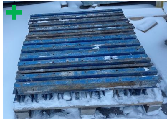
FR- tugevduspalk 0,9m