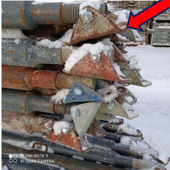
Super 10- max 5tk